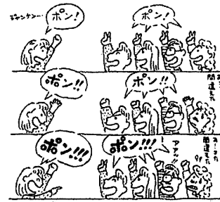
『あとだしジャンケン』 三浦一朗著、楽しいアイスブレイキングゲーム集より