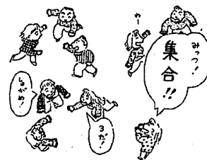
『数合わせゲーム』 三浦一朗著、楽しいアイスブレイキングゲーム集より