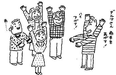
『だるまん』 三浦一朗著、楽しいアイスブレイキングゲーム集より