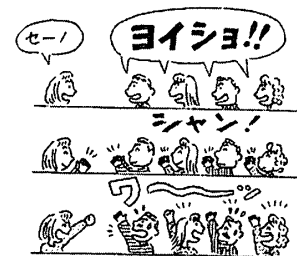
『グーパー』 三浦一朗著、楽しいアイスブレイキングゲーム集より

段階の順序を間違えると、難易度の順序が入れ替わってしまい、楽しさも半減しますので注意が必要です。