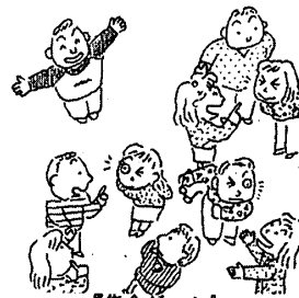
『集合ゲーム』 三浦一朗著、楽しいアイスブレイキングゲーム集より

各自の数を次のゲームや活動、目的に合わせて、最終回の数を考えておくと良いでしょう。